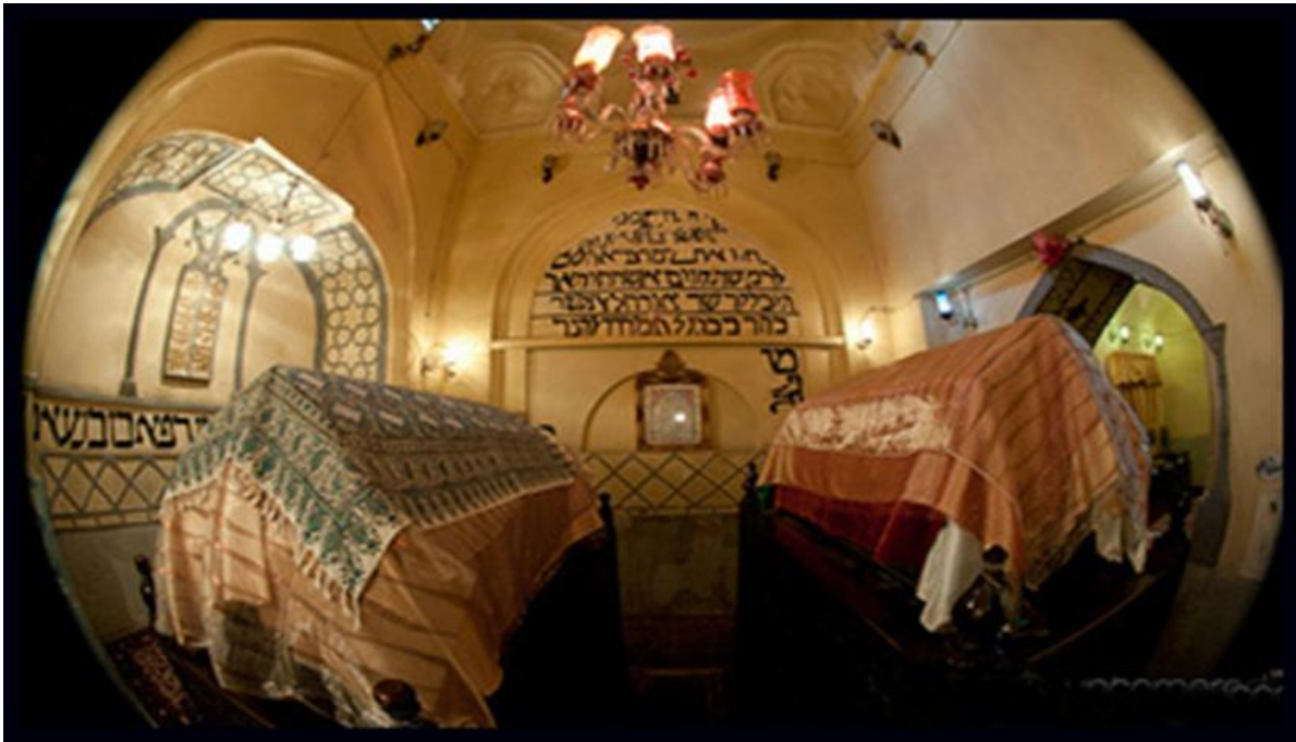
تالار آرامگاه استر و مردخای در همدان که ضریح آنان در کنار هم قرار دارد

پرسش - شما در گفت و گوی پیشین درباره آرامگاهی در شهر همدان سخن گفتید که طبق احادیث یهود، به نخستین شهبانوی یهودی ایران زمین به نام استر و پسر عموی او مردخای مربوط می شود که در دربار سلطنتی ایران خدمت می کرده است. می خواهیم به دور از باورهای دینی، و تنها از نظر پژوهشی و تاریخی بررسی کنیم که این زیارتگاه تا چه حد واقعا می تواند آرامگاه آن دو تن باشد که صحیفه ای به نام "تومار استر" در کتاب مقدس یهودیان به شرح روایت زندگی آنان می پردازد؟